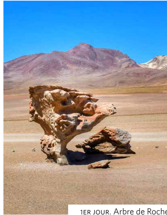
1ER JOUR. Arbre de Roche.