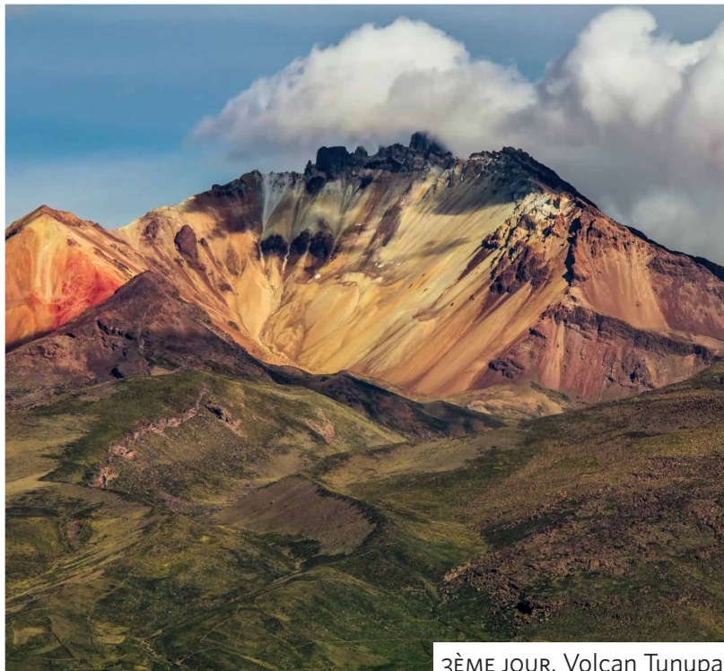
3ÈME JOUR. Volcan Tunupa.