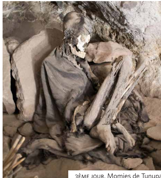
3ÈME JOUR. Momies de Tunupa.