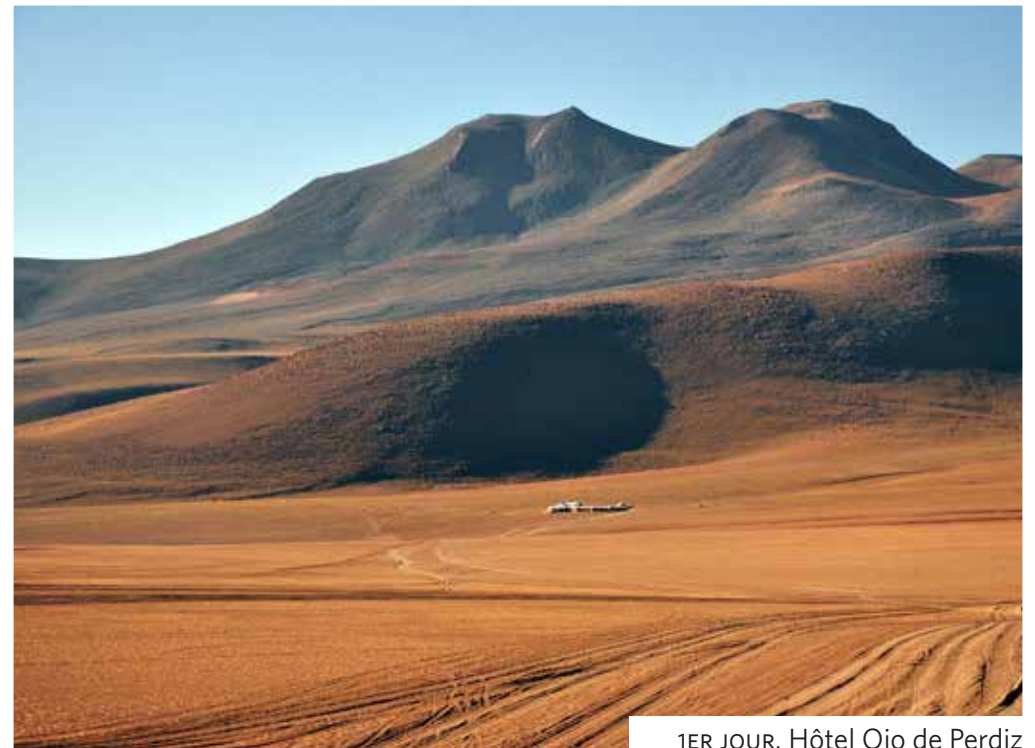
1ER JOUR. Hôtel Ojo de Perdiz