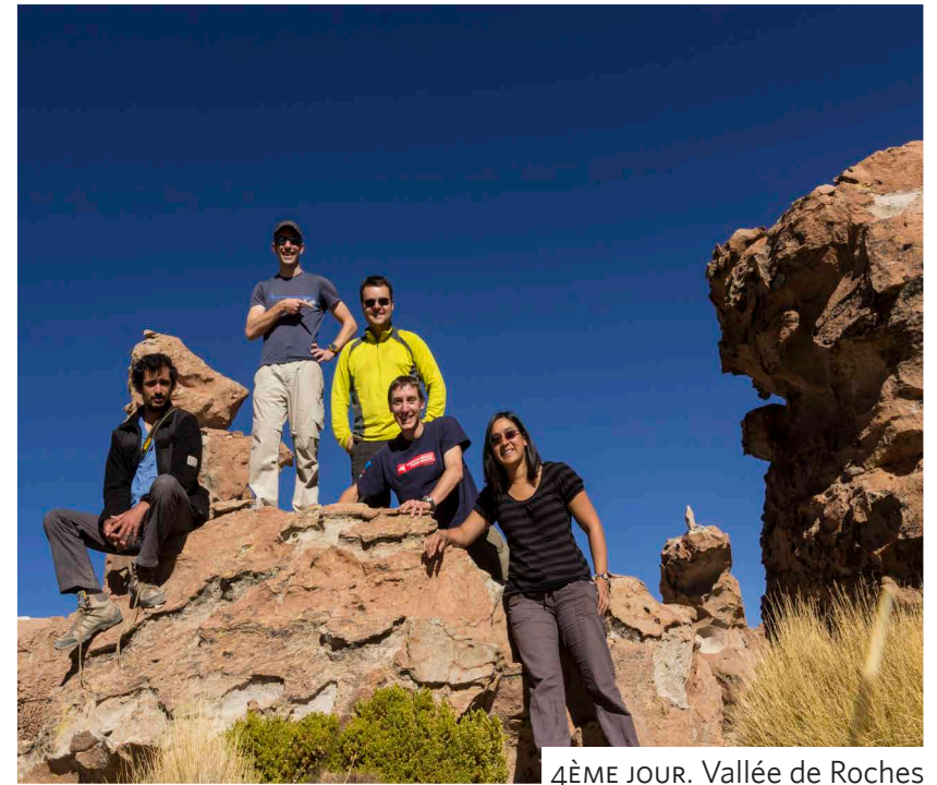
4ÈME JOUR. Vallée de Roches